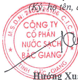
Hương Xuân Công