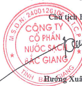
Hương Xuân Công